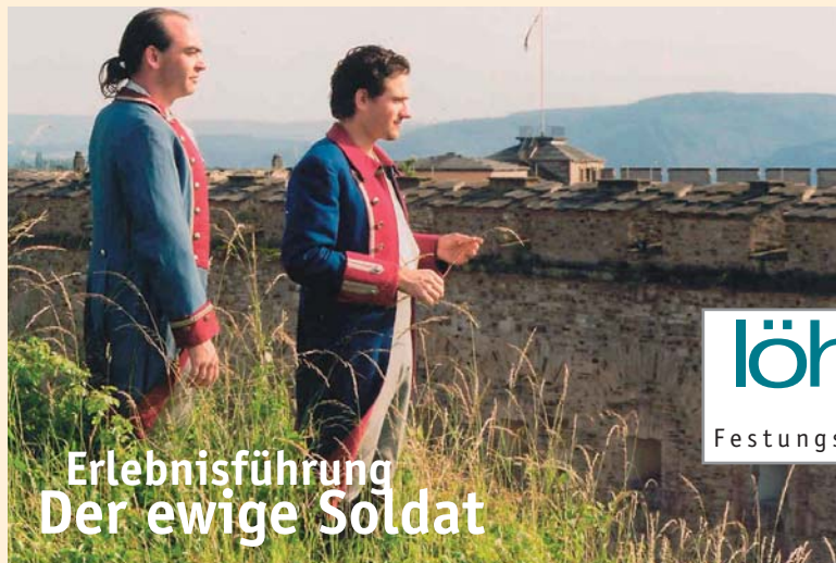
Erlebnisführung Der ewige Soldat

Wissenswertes über das ausgeklügelte preußische Befestigungssystem, den Soldatenalltag und kunsthistorische Besonderheiten erfährt man bei 45-minütigen Rundgängen über die weitläufige Anlage. Diese Touren bietet der Besucherdienst von Burgen, Schlösser, Altertüme in der Zeit vom 19. März bis zum 1. November täglich von 10 bis 17 Uhr an. Eine Ausstellung und ein Videofilm in drei Sprachen (deutsch, englisch, französisch) vermitteln weitere Eindrücke vom Leben auf einer Festung.