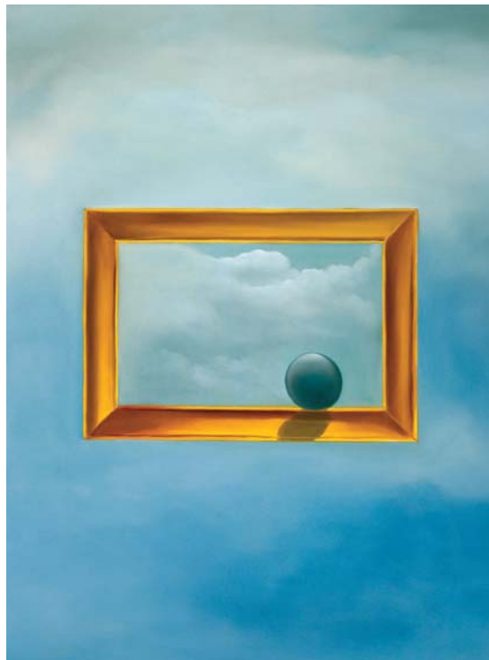
Dorél Dobocan: Wandernde Welt II

Kunst als Möglichkeit zum Dialog – das Begleitprogramm zur Ausstellung wendet sich unter anderem an Kinder und Jugendliche. So gibt es an vier Sonntagen eine Kombination aus Führung und Workshops zu Motiven und Themen des Künstlers. Auch die Jugendkunstwerkstatt bietet zwei Malkurse zur Ausstellung an.